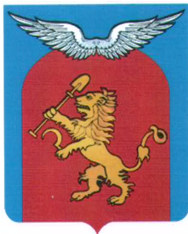
СХЕМА ТЕПЛОСНАБЖЕНИЯ ЕЛОВСКОГО СЕЛЬСОВЕТА ЕМЕЛЬЯНОВСКОГО РАЙОНА КРАСНОЯРСКОГО КРАЯ НА ПЕРИОД ДО 2028 ГОДА

Общество с ограниченной ответственностью «Сибирь»