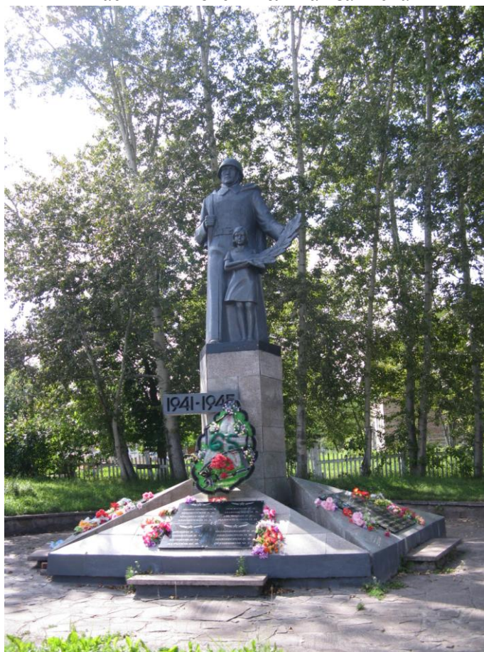
Красноярск, 2010 г.

Том I – Генеральный план Часть 1 – Пояснительная записка